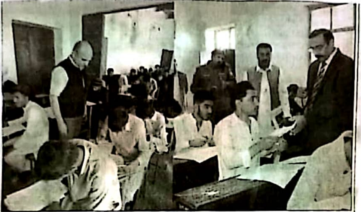
کمشنر راولپنڈی لیاقت علی چٹھا اور چیئر مین راولپنڈی تعلیمی بورڈ محمد نادر خان مختلف امتحانی مراکز کا دورہ کر رہے ہیں

ورق نامہ جہان پاکستان راولپنڈی ممبر نمبر 23-4-4