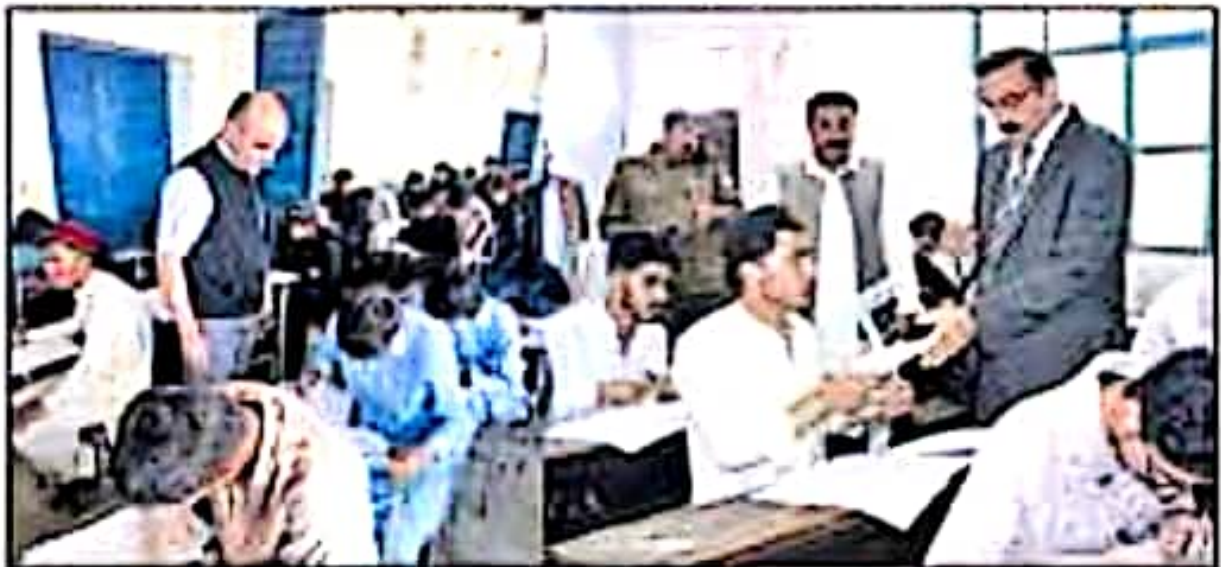
کمشنر بروقت ملی چٹھہ اور چیمبرن ایجوکیشن بورڈ امتحانی مرکز کا دورہ کر رہے ہیں

راولپنڈی (نامہ نگار خصوصی) ایجوکیشن بورڈ کے زیر اہتمام میٹرک کے سالانہ امتحانات ہاتھ ہورہے شروع ہو گئے ہیں، تمام امتحانی سینٹرز میں شفاف امتحانات کے لئے سخت انتظامات کیے گئے ہیں امتحانی سینٹرز میں کلوز سرکٹ کیمرے بھی لگائے گئے جبکہ اپنی کمشنر نے دفعہ 144 کے تحت تمام امتحانی سینٹرز میں غیر متعلقہ افراد کے چاروں اطراف 100 میٹر تک منع ہونے، امتحانی سینٹرز میں پولی مواد، موبائل فون، کیبلو لیٹرز، سب لے جانے پر پابندی لگا دی ہے، کمشنر راولپنڈی بروقت ملی چٹھہ نے میٹرک کے سالانہ امتحانی مرکز اچیر ہائر سیکنڈری سکول کا دورہ کیا جبکہ چیمبرن بورڈ عدنان خان نے بھی مختلف امتحانی سینٹرز کے دورے کیے اور جائزہ لیا، کمشنر راولپنڈی کا مختلف امتحانی ہال اور کمرہوں میں جاری امتحانات کا جائزہ لیا۔ کمشنر راولپنڈی کی طلباء کی حاضری اور رول نمبر سلیپ کی چیکنگ بھی کی طلبہ سے کھٹکھٹ کی۔ امتحانی