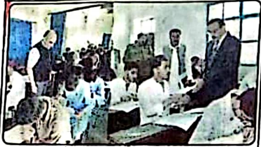
راہ پونڈی: کمشنر راہ پونڈی لہرت علی چٹھہ اور ڈیپٹی کمشنر ہورہ ہونے خان استحالی مراکز کا دورہ کر رہے ہیں

راہ پونڈی (جی ہات رپورٹ) ہورہ آف ایئر میٹینٹ اینڈ سیکورٹی ایگریگیشن راہ پونڈی کے ذریعہ انتظام احسن میٹرک فرسٹ اینڈ 2023 کے سلسلہ میں کمشنر راہ پونڈی لہرت علی چٹھہ نے گورنمنٹ اسیسٹنٹ ڈائریکٹر راہ پونڈی کا دورہ کیا اور اس کے دوران انہوں نے طلبی ہورہ کی طرف سے کئے گئے اقدامات کا جائزہ لیا اور اہمیت کا اظہار کیا اور انہوں نے کہا کہ چیلنج بیکری کی وجہ سے ہورہ پونڈی ڈویژن کے تمام اضلاع کی طلبی ہورہ ہے اور اس کے ساتھ رابطہ میں ہے، چیز میں شکی ہورہ راہ پونڈی گورنمنٹ خان نے گورنمنٹ ہورہ ہائی سکول ہورہ، گورنمنٹ گورن ہائی سکول ہورہ، گورنمنٹ ہائی سکول کونٹ گہ طلبی ہورہ ایک اور گورنمنٹ ہائی سکول انجیر طلبی ایک کے دورہ کیے اور اس کے دوران انہوں نے انہوں استحالی مراکز کے رہنما پر پوزیشن پر پوزیشن / ایچ پوزیشن اور گورنمنٹ کی مرکز میں رہنما کو چیلنج کیا اور استحالی ملے کو وجوہات جاری کرتے ہوئے تھا حکومت پنجاب کی جانب سے جاری کردہ ایک نوٹیفکیشن سے عملدرآمد کروا لیا جائے اور اس سلسلہ میں کسی قسم کی کوئی تاخیر نہ ہو اور اس کی جانچ لیا جائے۔ اگر کوئی ایس او میں کی طرف آندی کا مرتبہ پایا گیا تو اس کی طرف سے اس کا دورہ لیا گیا اور ساتھ ساتھ ایف آئی آر کا اندراج بھی کر لیا جائے گا۔ سیکرٹری انچارج چیسر پنجاب چاہے ایئر چیسر میٹرک کے استحقاق میں سخت دقتوں سمیت عملی سے ہونے کے خاتمے کیلئے ہرگز ہیں۔