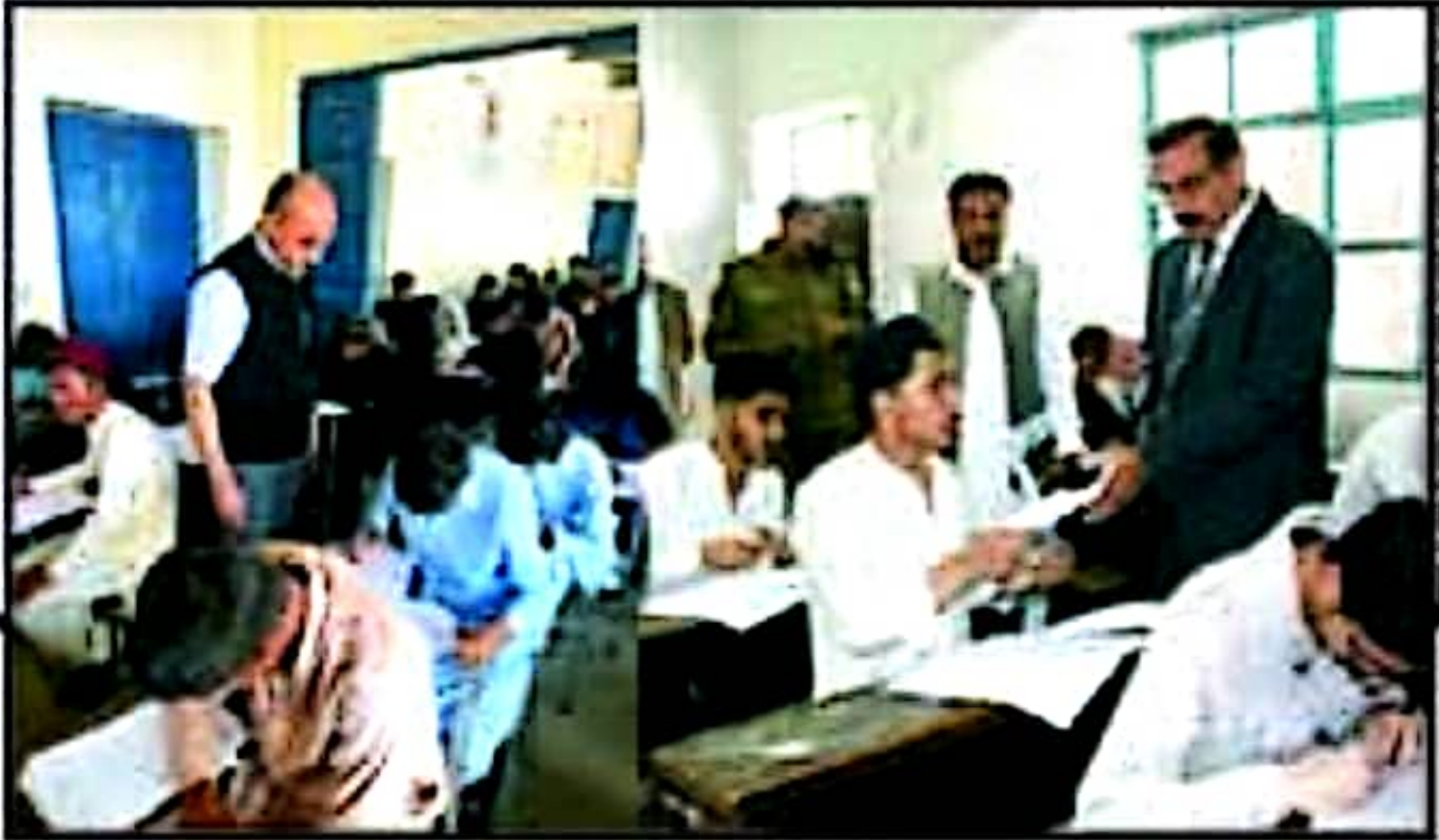
کمشنر راولپنڈی لیاقت علی چٹھہ، چیئر مین بورڈ محمد عدنان خان کے ہمراہ امتحانی سنٹر کا دورہ کر رہے ہیں۔

انک (ڈسٹرکٹ ریپورٹر) کمشنر راولپنڈی لیاقت علی چٹھہ، چیئر مین تعلیمی بورڈ راولپنڈی محمد عدنان خان اور کنٹرولر امتحانات سماجہ محمود قادری نے مختلف امتحانی مراکز کے دورے راولپنڈی (پ۔س) بورڈ آف انٹرمیڈیٹ اینڈ سیکنڈری ایجوکیشن راولپنڈی کے ذریعہ تمام امتحانی میٹرک فرسٹ اینڈ سول 2023 کے سلسلہ میں کمشنر راولپنڈی لیاقت علی چٹھہ نے گورنمنٹ ڈیپارٹمنٹ ہائر سیکنڈری سکول راولپنڈی کا دورہ کیا اور دورے کے