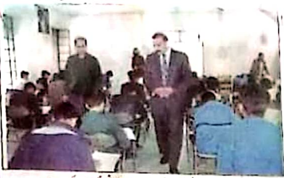
راولپنڈی ایلیٹ ملی ہائر میٹرک کے سالانہ امتحانی مراکز ۲۰۱۱ء کو کھلے ہیں